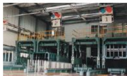
コンテナ積替設備