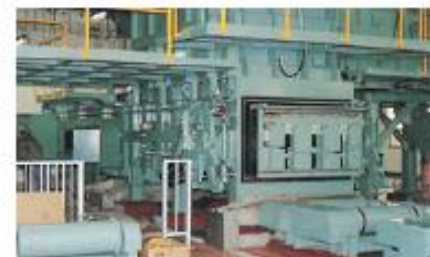
ごみ圧縮機(コンパクタ)