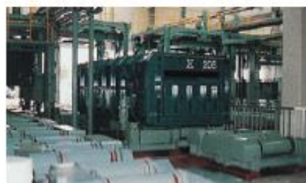
コンテナ保管設備