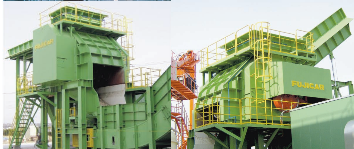
FHPS プレシュレッダー